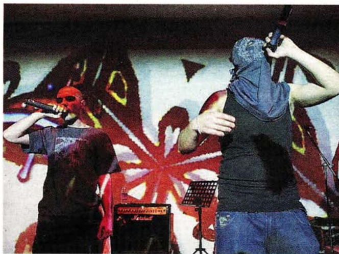
In scena Un momento di «X(ics) Racconti crudeli della giovinezza»